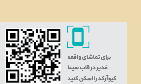
برای تماشا ی واقعه غدیر در قاب سیما کوآرکد را اسکن کنید

واقعه غدیر و جانشین خواندن حضرت علی (ع) از سوی پیامبر (ص) تاکنون در آثار رادیویی و تلویزیونی در قالب برنامه‌های گفت‌و محور، مستند و ... مورد توجه قرار گرفته است اما با وجود پرداختن به آن در برخی از آثار نمایشی در حال تولید و پخش شده از شبکه‌های مختلف، کمتر به صورت مستقل و کامل در یک اثر به نمایش درآمده است.