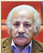
سعید پیردوست بازیگر تلویزیون و سینما