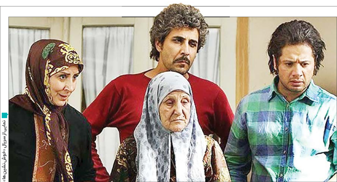
نمایش از سریال «خوش‌نشین‌ها»

پویش نجات‌آب است و مخاطبان می‌توانند فیلم‌های کوتاه و تصاویر خود از مدل‌ها و روش‌های مختلف و متنوع صرفه‌جویی و درست‌مصرف‌کردن آب در بخش‌های مختلف خانگی، صنعتی و کشاورزی را به برنامه‌های مزبور ارسال کنند. برنامه «رنگین‌کمان» ویژه رده سنی کودکان در پویش نجات‌آب، آموزش‌هایی کاربردی برای نسل‌های آینده خواهد داشت و از کودکان می‌خواهد با ارسال نقاشی مرتبط با این موضوع، به پویش نجات‌آب بپیوندند.