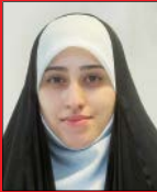
مریم‌عاقلی گروه سیاسی

دیروز که حسین امیرعبداللّه‌یان، وزیر خارجه کشورمان در ساختمان وزارت خارجه روسیه با سرگنی لاوروف، همتای روسی خود دیدار کرد، دوباره گفت‌وگوی طرفین به مسائل پادمانی به عنوان یکی از مهم‌ترین پایه‌های توافق هم کشیده شد. امیرعبداللّه‌یان ضمن این‌که گفته است برای تضمین، نیازمند متن قوی‌تر هستیم، تاکید کرده: «در خصوص نفو تحریم‌ها ما آخرین متن طرف آمریکایی را دریافت کردیم و همکاران من در حال بررسی هستند. اما ما در مورد تضمین نیازمند متنی قوی‌تر هستیم.» نکته بسیار مهمی که وزیر خارجه بار دیگر آن را یادآوری کرده این‌که: «یکی از موضوعاتی که مورد توجه قرار گرفته و در متن هم نیاز نیرومند سازی است، این‌که اولاً آژانس از رفتار سیاسی خود فاصله بگیرد و ثانیاً برای ایران قابل قبول نیست بعد از بازگشت همه طرف‌ها ما شاهد اتهام‌زنی آژانس باشیم.» این یعنی مسائل پادمانی آژانس بیشتر از همیشه مورد توجه ماست و اگر آمریکا یک بار برای همیشه واقع‌بینانه عمل و متن موجود را غنی‌سازی کند، رسیدن به توافق دور از دسترس نیست و مذاکرات وین و دوحه و دوباره وین به نتیجه خواهد رسید.