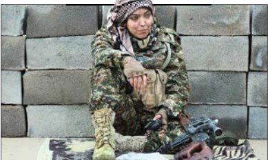
صحنه‌ای از فیلم کوتاه «راحانا» به کارگردانی کاظم دانشی

سوری به نام راحانا توانسته است تعداد زیادی از نیروهای داعش را به هلاکت برساند.» از عوامل این فیلم می‌توان به کارگردان: کاظم دانشی، نویسنده فیلمنامه: محمد منصوبی و کاظم دانشی، بر اساس طرحی از سید پرویز شجاعی، مدیر فیلمبرداری: سروش حضرتی، صدابرداران: احمد صابری، حامد حسین زاده و طراح چهره پردازی: امیرترابی اشاره کرد.