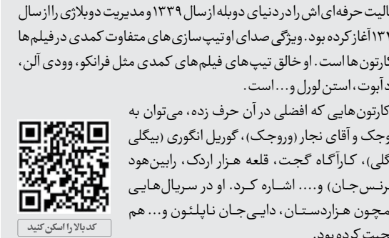
کد پالا را اسکن کنید