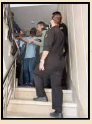
قاتل در حال بازسازی صحنه جرم

متهم به قتل در تشریح ماجرا گفت: «اهل یکی از شهرهای شمالی کشور هستم، حدود