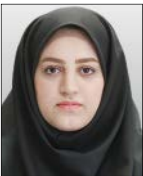
نوشتن مجلسی گروه رسانه