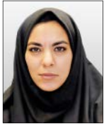
نگرش کیانی گروه رسانه