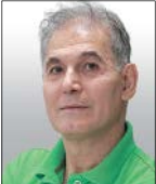
کیاکوس زیاری آکروه فرهنگ و هنر

اقدام استراتژیست‌های اروپایی و آمریکایی برای کمک به امکان حضور «جوینلد/ سرزمین خوشی» در رقابت‌های بخش بهترین فیلم بین‌المللی مراسم اسکار، نکته‌ای است که از سوی محافل اجتماعی در این کشور آسیایی مورد توجه و بحث قرار گرفته است. در شرایطی که این نظریه در پاکستان مطرح است که این اقدام می‌تواند به نوعی مداخله در امور داخلی این کشور به حساب بیاید، احتمال موضعگیری رسمی مقامات دولتی کشور زیاد است. استراتژیست‌های امور جایزه اسکار به نشریه ورایتی گفته‌اند اگر جوینلد تا سه‌ام نوامبر(۹ آذر) برای یک هفته در فرانسه اکران عمومی شود، قابلیت شرکت در رقابت‌های اسکاری را به‌دست می‌آورد. براساس مقررات آکادمی اسکار، هر فیلمی که بخواهد خودش را