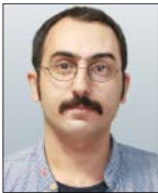
علی رستگار آکروه فرهنگ و هنر

همین چند روز پیش بود که مطلبی ترجمه شده از اسکات فینبرگ، منتقد و نویسنده نشریه مشهور هالیوود ریپورتر درباره پیش‌بینی شانس‌های اصلی اسکار بخش بین‌الملل منتشر شد. به شکل عجیبی در فهرست ۲۰ فیلمی فینبرگ، هیچ نامی از فیلم «جنگ جهانی سوم» برده نند و این تحلیلگر هیچ شانس‌ی برای نماینده سینمای ایران قائل نشد. در پیش‌بینی این نویسنده فیلم‌های «تصمیم به رفتی» ساخته پارک چان ووک از کره جنوبی، «نزدیک» ساخته لوکاس دونت از بلژیک، «در جبهه غرب خبری نیست» ساخته ادوارد برگر محصول آلمان، «کورساز» ساخته ماری کروتزر از اتریش و «عنکبوت مقدس» ساخته علی عباسی از دانمارک، شانس‌های اصلی نامزدی اسکار ۲۰۲۳ هستند. حتی در اولویت‌های بعدی او هم جایی برای فیلم هومن سیدی نیست و «آرژانتین ۱۹۸۵» از آرژانتین، «دختر ساکت» از ایرلند، «ای‌او» از لهستان، «عمر مقدس» از فرانسه و «باردو» ساخته‌الخاندرو گونزالز ایناریتواز دیگر فیلم‌هایی‌است که احتمال حضور آنها در میان برنج فیلم نهایی اسکار وجود دارد. عجیب‌تر این‌که فینبرگ حتی برای فیلم‌های اسپانیا، ژاپن، پاکستان و اوکراین کورسوی امیدی درنظر گرفته اما حتی حاضر نشده اسکار را در دستان هومن سیدی ببیند.