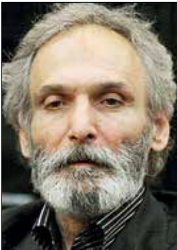
جهانگیر الماسی، بازیگر