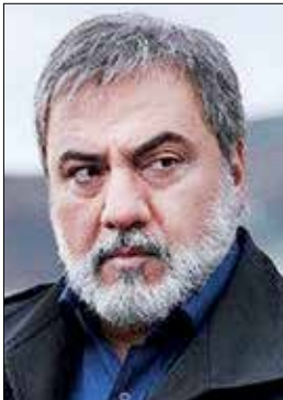
فرهاد قاتمیان، بازیگر