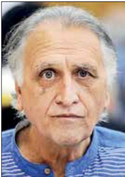
احمد نجفی، بازیگر