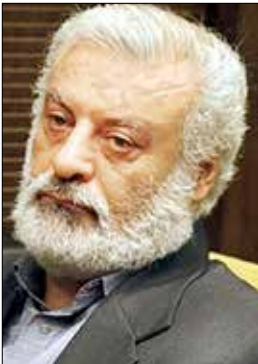
جهانبخش سلطانی، بازیگر