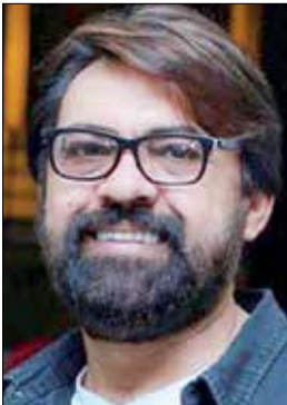
رضا ایرانمنش، بازیگر