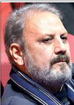
جلیل فرجاد، بازیگر