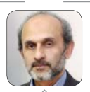
دکتر پیمان جبلی رئیس رسانه ملی