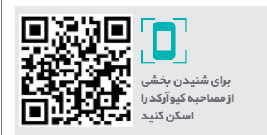
برای شنیدن بخشی از مصاحبه کیوآرکد را اسکن کنید

ما در فصل سوم فقط دو روز آخر هفته، یعنی پنجشنبه و جمعه روی آنتن می‌رفتیم و شاید باور نکنید اما از بعضی مسؤؤلان که برای حضور در برنامه دعوت می‌کردیم به علت روز آخر هفته بودن و تعطیلی، نمی‌پذیرفتند. شرایط تمرین و اردوی ورزشکاران‌مان نیز مقدراری دست‌وپای ما را می‌بست و بارها پیش آمده بود که ورزشکارمان از سر تمرین به برنامه می‌آمد و بعد از برنامه مجدداً به تمرینش برمی‌گشت. پس هر روز روی آنتن بودن این امکان را برای شما فراهم می‌کند که به موضوعات، سر جای برداشتن رسیدگی کنید و احتمالاً موجب خواهد شد که مهمانان‌مان دعوت‌مان را آسان‌تر بپذیرند. در مجموع این که قرار است با برنامه‌ای مطالبه‌گر و چالش‌محور هر روز عصر روی آنتن بروم برای خودم هم چالش‌برانگیز است و گمان می‌کنم اتفاقات خوبی رخ خواهد داد.