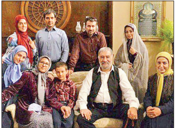
تیکه زمین نخستین تجربه سرپال‌سازی مهدی کریم‌پور پس از ساخت چهار فیلم بلند سینمایی «جایی دیگر»، «چه کسی امیر را کشت؟»، «تهران طهران؟» و «بیل چوبی» به‌محسوب می‌شد.

تیکه زمین نخستین تجربه سرپال‌سازی مهدی کریم‌پور پس از ساخت چهار فیلم بلند سینمایی «جایی دیگر»، «چه کسی امیر را کشت؟»، «تهران طهران؟» و «بیل چوبی» به‌محسوب می‌شد. ثانواهای قدیمی تهران است که هنوز ناشن راوری ترازمی‌کشد و دست مشتري می‌دهد، او نزد مردم احترام دارد و بزرگ محل است. نظم این زندگی از روزی به‌هم می‌خورد که دو نانوالی شخصی به نام اتفاقات را به دلیل تخلف می‌بندد. کارگردانی به