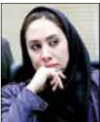
ساراگودرزی گروه ورزش

بدعهدی آمریکایی‌ها در صدور ویزای ورزشکاران ایرانی به جنجالی دامنه‌دار در این حوزه تبدیل شده است. آمریکا در شرایطی تا پیش از این، روایت‌د تیم‌ها و چهره‌های ورزشی ایران را صادر می‌کرد که حالا موضع شدیدی در قبال این قضیه اتخاذ کرده است. به گونه‌ای که طی یک سال گذشته در هر رویدادی که میزبان بوده یا به ایرانی‌ها ویزا نداده و یا این که لحظه آخر و با سخت‌گیری زیاد به آنها ویزا داده است. تازه‌ترین مورد این جنجال خسته‌کننده، به حضور تیم‌ملی کشتی آزاد در رقابت‌های جام جهانی ۲۰۲۲ مربوط می‌شود که قرار است ۱۹ و ۲۰ آذر در ایالت آیووا برگزار شود. در شرایطی که کمتر از دو هفته دیگر به آغاز این مسابقات باقی مانده اما تا امروز روایت‌د هیچ یک از کشتی‌گیران و عوامل تیم صادر نشده و این در حالی است که هفته گذشته اعضای تیم‌ملی کشتی آزاد در دو گروه به دویی رفتند تا برای گرفتن ویزای آمریکا مصاحبه بدهند.