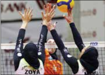
ساراگودرزی گروه ورزش

در صورتی که مشکلی در مسیر اعزام این تیم به آمریکا ایجاد نشود، آزادکاران ایران در مرحله مقدماتی با ژاپن و تیم منتخب جهان هم‌گروه خواهند شد. در گروه دیگر نیز سه تیم آمریکا، گرجستان و مغولستان حضور دارند. به این ترتیب رویارویی ایران و آمریکا