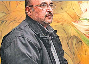
نگاره حاج قاسم، در برج آزادی

نمایشگاه انفرادی «نور خدا نور حسین(ع) است و بس» از ۱۷ دی تا ۷ بهمن ماه ۱۴۰۱ هر روز از ساعت ۱۰ تا ۱۸ و روزهای تعطیل از ساعت ۱۴ تا ۱۸ را نگرارخانه اصلی فرهنگسرای نیاوران میزبان علاقه‌مندان و هنردوستان است.